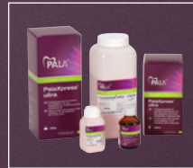
PalaXpress ultra Lieferform und Artikelnummer