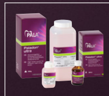
Paladon ultra Lieferform und Artikelnummer